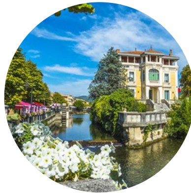
ISLE SUR SORGUE