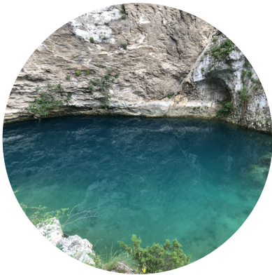
FONTAINE DU VAUCLUSE