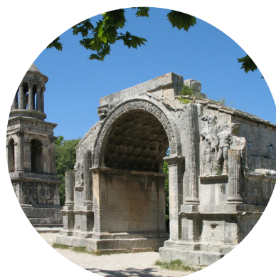
ST REMY DE PROVENCE